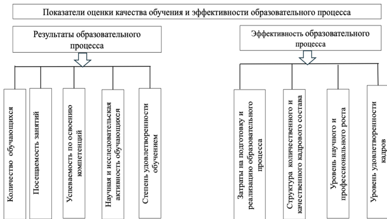
Рисунок 4 – Структура оценки качества обучения и эффективности образовательного процесса

его теоретических знаний, но и уровня эффективности и реализации профессиональных компетенций по конкретным процедурам на этапах принятия решений.