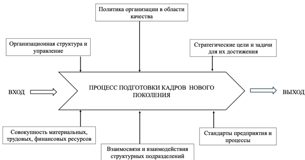
Рисунок 1 – Структура интеграции требований, имеющих отношение к процессу подготовки кадров нового поколения

При применении процессного управления в образовании, в первую очередь, следует обратить внимание на разносторонность структуры и объема реализуемых кадровым составом вузов задач, отличающихся, с одной стороны, творческим подходом, с другой стороны, весьма формализованными и зависимыми от изменения внешних и внутренних факторов образовательной среды. Значительная часть из них относятся к факторам, недостаточно изученным и трудно преодолимым для построения эффективной системы подготовки кадров будущего поколения (рис. 1).