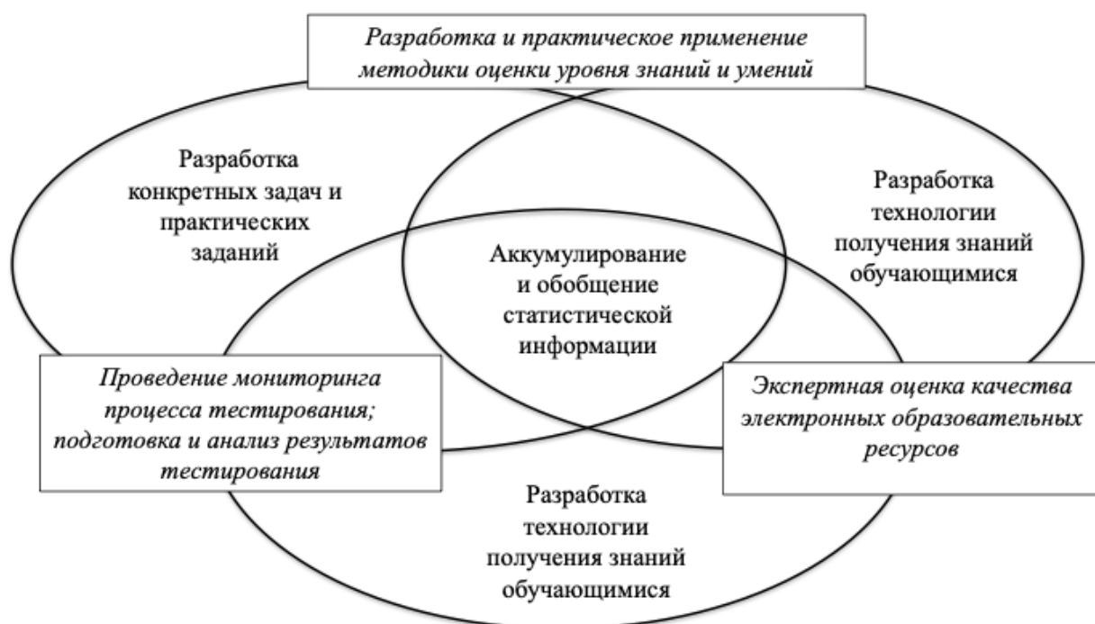
Рисунок 5 – Компоненты системы экспертной оценки качества научного и образовательного процесса

обучающихся и возможности предоставления аттестуемому совокупности вопросов и заданий в зависимости от сложности этапов обучения, исключая возможные противоречия между областью профессиональных компетенций и качеством их освоения.