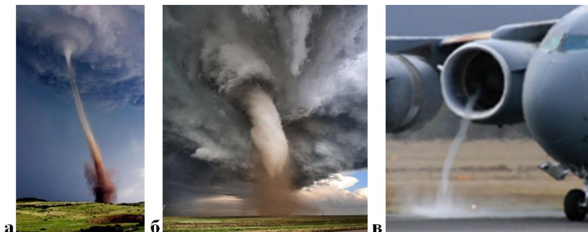
Рисунок 1– Вихри у подстилающей поверхности: а – смерч с признаком вихревой трубки, б – торнадо с активной вихревой трубкой, в – техногенный вихрь стокового типа перед работающим ГТД на земле

Полноценное исследование вихрей и связанных с ними явлений невозможно без решения вышеперечисленных противоречий, что в свою очередь требует определиться с методами нахождения решений на основе анализа имеющегося материала по данной теме.