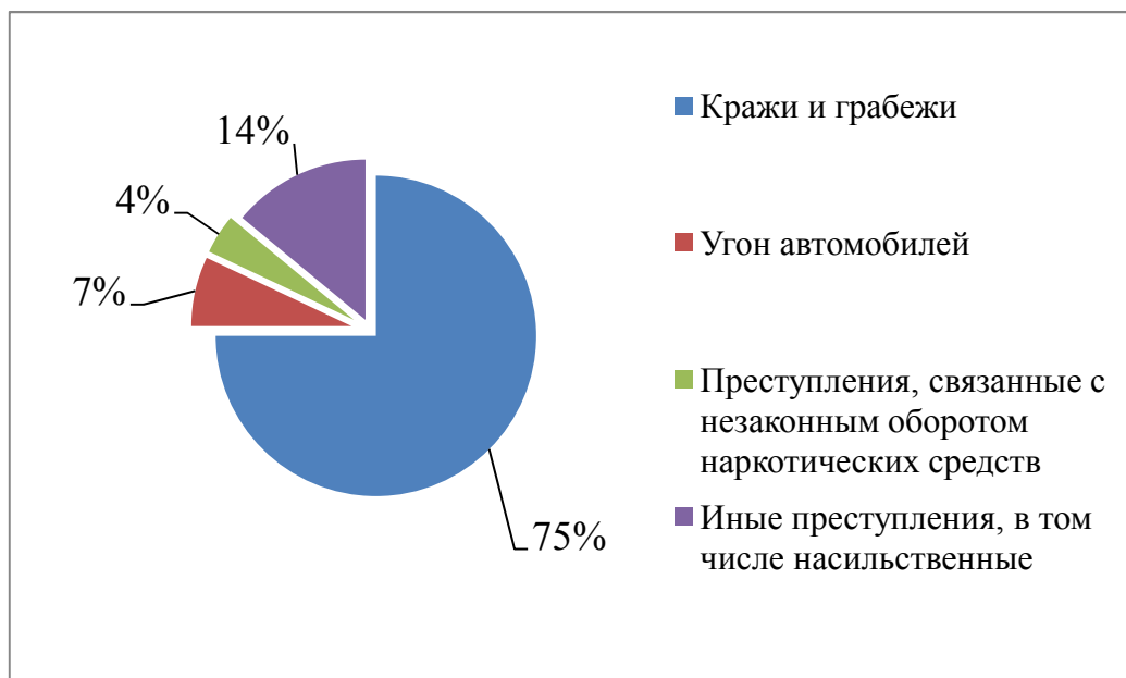
Рисунок 1 – Структура преступности несовершеннолетних в Иркутской области в 2020 г.

Структура преступности несовершеннолетних остается стабильной на протяжении многих лет: кража и грабежи (около 75%), угоны автотранспортных средств (7%), преступления, связанные с незаконным оборотом наркотических средств (4%) (рис. 1) [Министерство внутренних дел Российской Федерации, 2021].