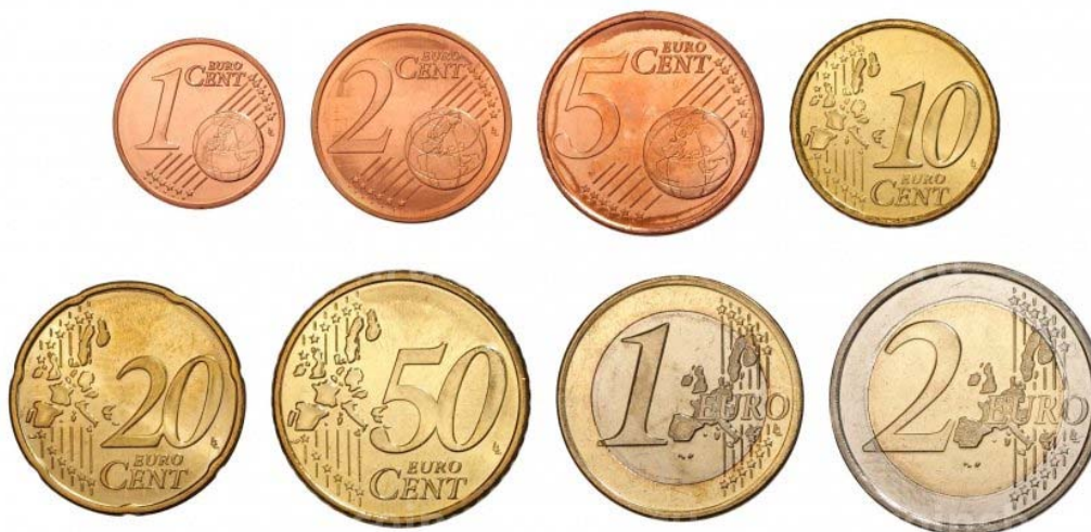
Рисунок 3 – Монеты евро

Монетный ряд включает в себя монеты достоинством: 1, 2 евро и 1, 2, 5, 10, 20, 50 евроцентов. На реверсе (оборотная сторона) изображен общий для всех стран рисунок: контуры Европы с 12 звёздами Евросоюза. Аверс (лицевая сторона) является национальной стороной, где отчеканен рисунок с чертами государств, которые их выпускают [Информационный каталог евро 2007-2020].