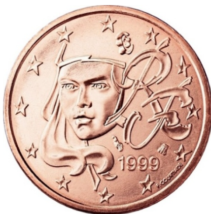
Рисунок 4 – Марианна [Информационный каталог евро]

На 10, 20, 50 евроцентах изображалась девушка-сеятельница. Этот рисунок использовался во Франции более 100 лет, в том числе на монете в 1 франк, выпущенной в обращение во время денежной реформы 1960 года. Дизайнер Лорен Джорло (Laurent Jorlo) модернизировал рисунок. По его словам – «Это современная, всегда актуальная гравюра представляет Францию, которая остается верной своим интересам, интегрируясь в Европу» [Информационный каталог евро] (рис. 5).