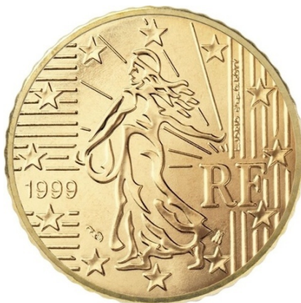
Рисунок 5 – Девушка-сеятельница [Информационный каталог евро]

На 10, 20, 50 евроцентах изображалась девушка-сеятельница. Этот рисунок использовался во Франции более 100 лет, в том числе на монете в 1 франк, выпущенной в обращение во время денежной реформы 1960 года. Дизайнер Лорен Джорло (Laurent Jorlo) модернизировал рисунок. По его словам – «Это современная, всегда актуальная гравюра представляет Францию, которая остается верной своим интересам, интегрируясь в Европу» [Информационный каталог евро] (рис. 5).