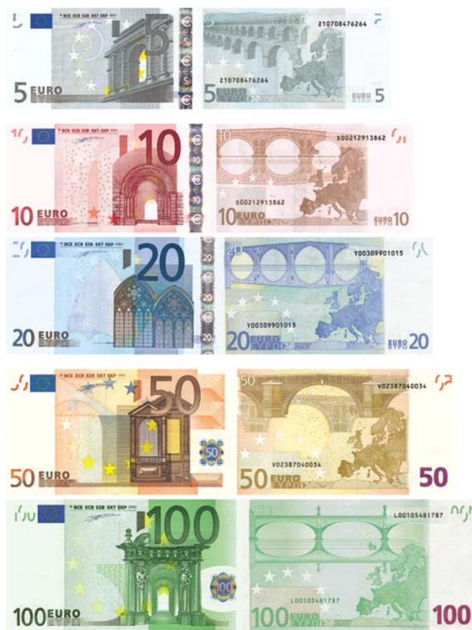
Рисунок 2 – Банкноты евро [ЦЭАиЭ]

Все изображения, архитектурные объекты, находящиеся на купюрах, никогда не существовали в реальной жизни. Но не прекращаются споры о том, какие существующие мосты послужили прообразом изображенных на купюрах [Воробьева, 2019]. На каждой банкноте передаются особенности каждой из эпох.