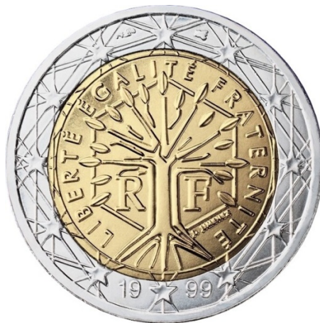
Рисунок 6 – Дерево свободы [Информационный каталог евро]

Франции, также связанный с Великой Французской Революцией. Через год после революции в одной из деревень крестьяне посадили дерево и назвали его «деревом свободы». Традиция быстро распространилась по всей территории страны [Информационный каталог евро] (рис. 6).