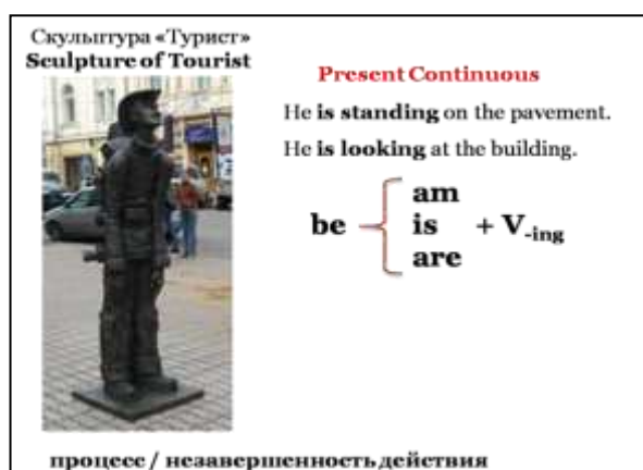
Рис. 1. Соотнесение видо-временной формы настоящего продолженного времени с фрагментом действительности

- межличностные отношения членов социума, проживающих на данной территории и являющихся носителями изучаемого иностранного языка. Соответственно, обозначение этой специфики не имеет прямых аналогов в парадигме «родной язык – иностранный язык». Например, специальная должность тьютор. Это человек, который общается со студентами лично, даёт им специальные частные (индивидуальные) консультации по вопросам обучения и ряду других, советует, поддерживает. Должность шериф – для охраны общественного порядка в США. Это избранный офицер, ответственный за порядок.