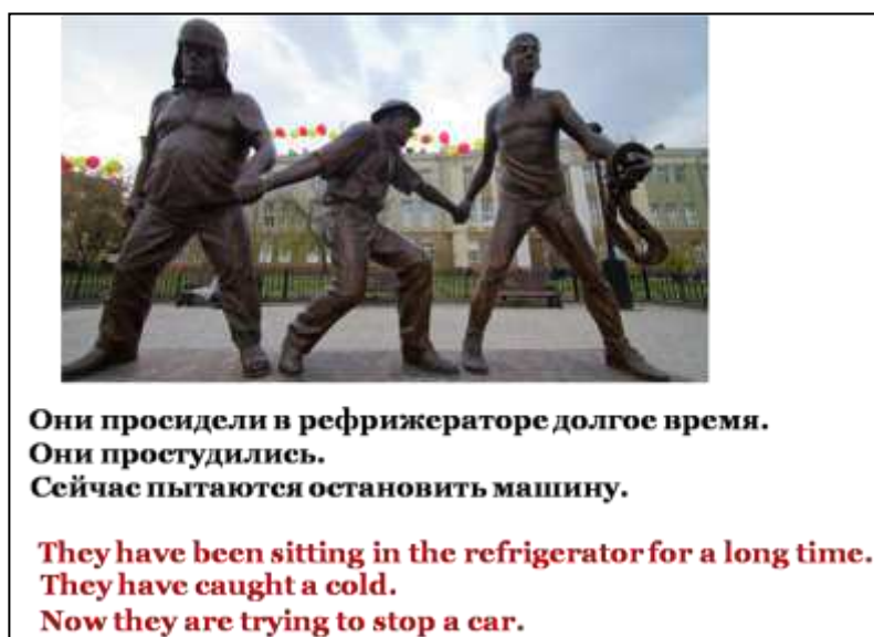
Рис. 5. Соотнесение трёх видо-временных форм настоящего длительного времени с фрагментом действительности

Учитель организует деятельность обучающихся таким образом, чтобы подвести их к выводу о различии в видении и маркировке одних и тех же ситуаций носителями разных языков. С этой целью используются: сравнение, анализ, синтез, умозаключение. Дальнейшая деятельность обучающихся направлена на комментирование аналогичных ситуаций. Они, также, представлены иллюстрациями фрагментов действительности, отраженных в скульптурах.