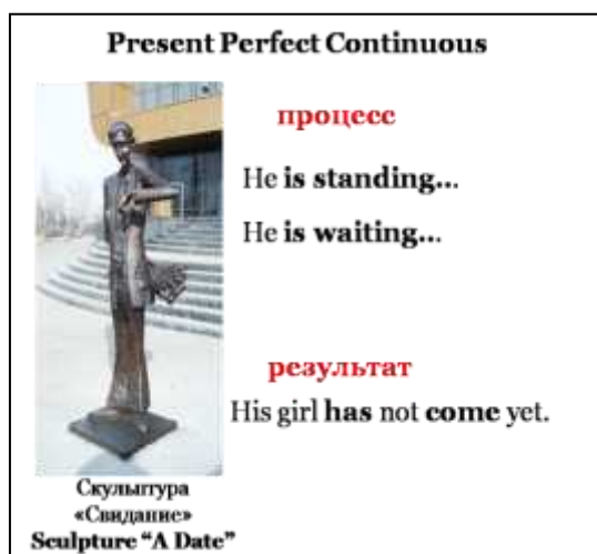
Рис. 3. Соотнесение видо-временной формы настоящего совершенного длительного времени с фрагментом действительности

женными в скульптурах Турист и Свидание. Молодой человек смотрит на часы - он знает, как долго он ждёт. Тем самым мы обращаем внимание на то, что понятие длительности действия выражается уже через другую видо-временную