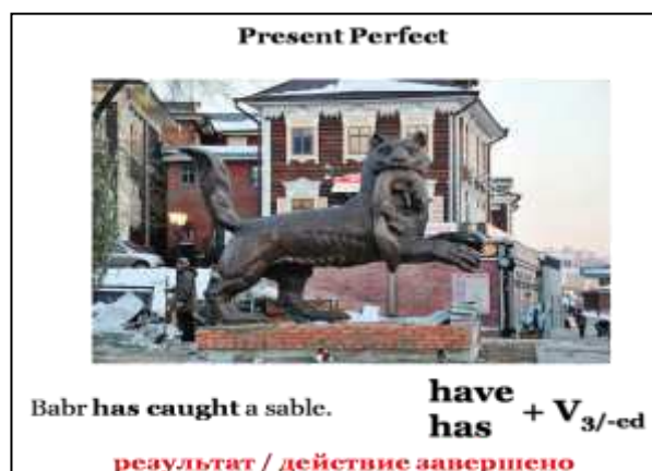
Рис. 2. Соотнесение видо-временной формы настоящего совершенного времени с фрагментом действительности

Рассмотренная типология взаимодействия языков была использована нами при обучении грамматике английского языка, а именно, ситуативному употреблению грамматических времён Present Continuous (настоящее продолженное время), Present Perfect (настоящее совершенное время), Present Perfect Continuous (настоящее совершенное продолженное время). Предлагаемая технология способствует снятию трудностей в различении значения и употреблении видо-временных форм глаголов группы настоящего времени.