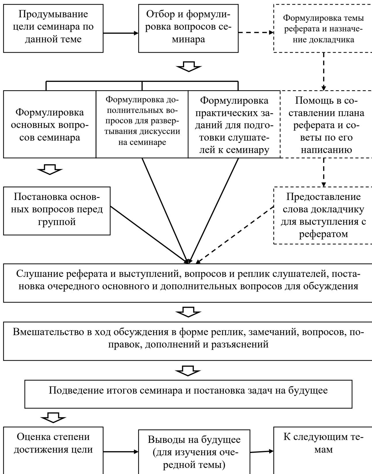
Рис. 4. Схема ориентировочной основы действия преподавателя по подготовке к проведению дискуссии на семинарском занятии *