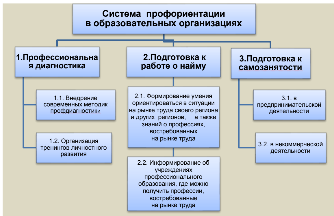
Рис. 3 Система профориентации в образовательных организациях

РФ 2013-го года, в котором неожиданно Президент сказал, что нужно возродить в школах профориентацию. А с другой – моим внуком, который однажды пришёл и спросил меня: «Кто такие секретарь-машинистка и председатель профсоюзного комитета?». Как выяснилось, их класс водили в Центр занятости и тестировали по профдиагностике по программе 1992 г. и там, соответственно, были такие профессии.