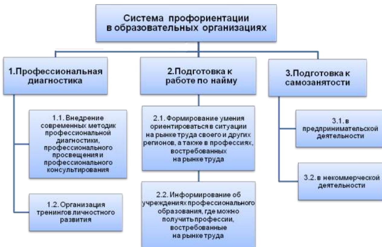
Рис. 2. Новая система профориентации в общеобразовательных организациях

Представляется, что новая система профориентации в общеобразовательных организациях должна включать в себя следующие обязательные блоки (Рис. 2):